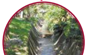
Andén Subtramo 2 del Parque Lineal Quebrada La Tinaja $153 millones.