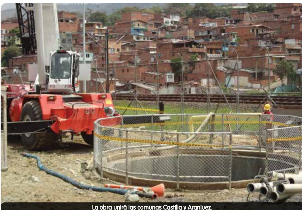
La obra unirá las comunas Castilla y Aranjuez.