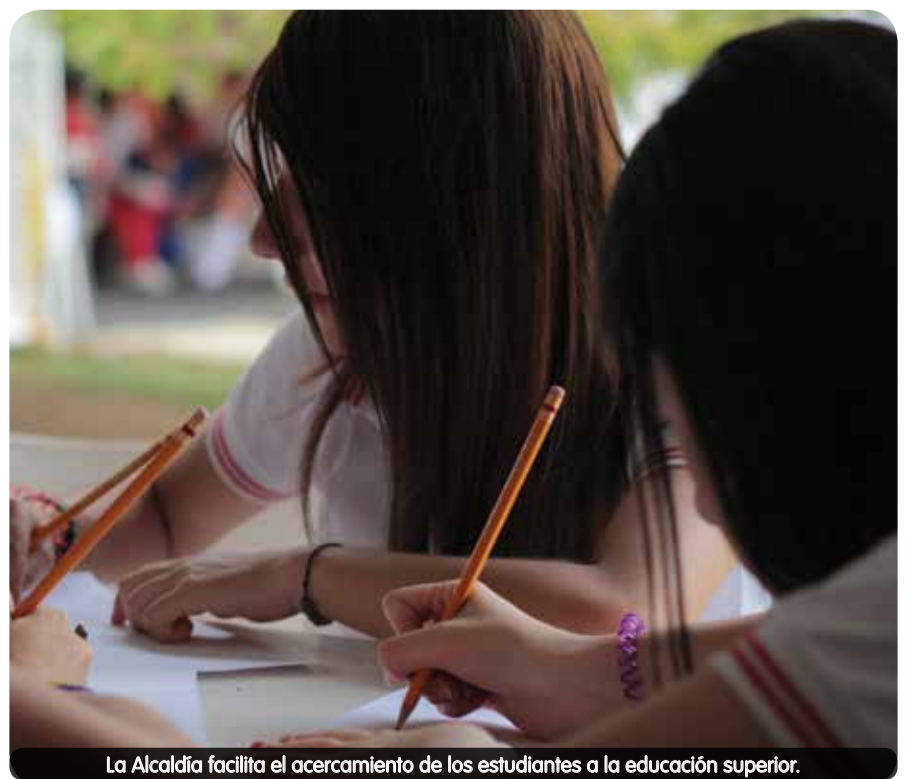
La Alcaldía facilita el acercamiento de los estudiantes a la educación superior.

Sapiencia ya entregó este año estímulos por $184 millones, apoyando la educación superior de 30 bachilleres destacados en toda la ciudad.