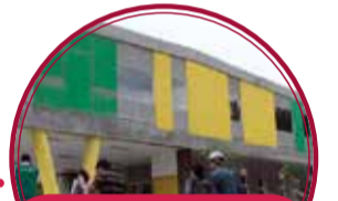
Construcción graderías de las canchas de rugby, Unidad Deportiva Castilla $180 millones