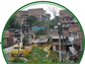
Puente peatonal entre los barrios Kennedy y La Esperanza $50 millones