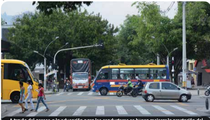
A través del acceso a la educación para los conductores se busca mejorar la prestación del servicio a los usuarios.

Más de 1.400 conductores de transporte público de Medellín tuvieron la oportunidad de participar en la convocatoria que realizó la Alcaldía en el primer trimestre de 2014 para darles la oportunidad de culminar sus estudios de primaria y secundaria en 12 instituciones educativas de la ciudad.