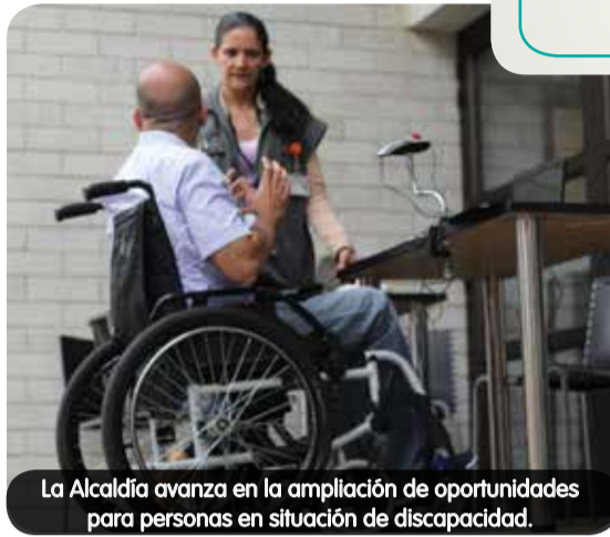
La Alcaldía avanza en la ampliación de oportunidades para personas en situación de discapacidad.

que se acercaron a los funcionarios del Municipio con una fotocopia del documento de identidad, el registro civil de nacimiento, un certificado médico y otros papeles que les darán acceso a apoyo económico, subsidio de transporte, educación, inclusión laboral y otros beneficios que la Administración tiene para esta población. Entre los 723 habitantes de Castilla que se acercaron a la Unidad