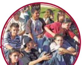
CIB Florencia $4.000 millones