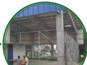
Cubierta Boyacá Brisas del Norte $670 millones