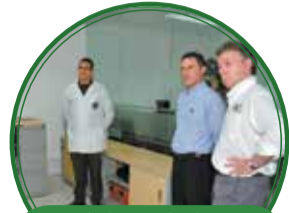
Laboratorio de criminalística Dijín $10.839 millones