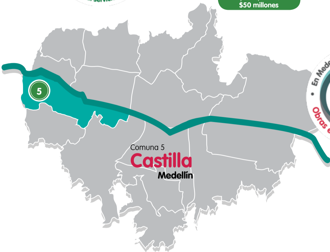
Comuna 5 Castilla Medellín