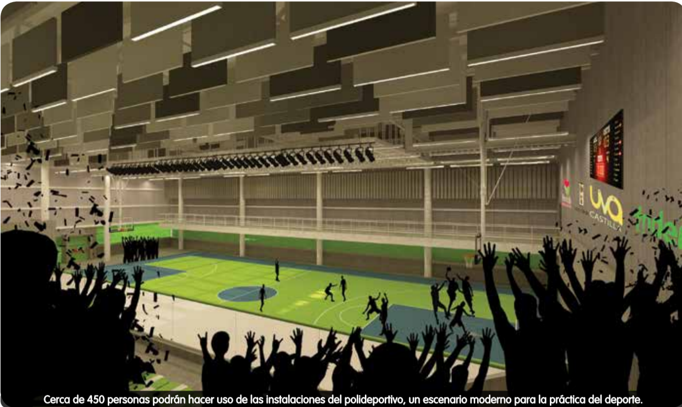
Cerca de 450 personas podrán hacer uso de las instalaciones del polideportivo, un escenario moderno para la práctica del deporte.

Los espacios imaginados y plasmados en dibujos por la comunidad de Castilla ya toman forma en la Unidad de Vida Articulada (UVA) Castilla, un lugar en el que dará inicio la transformación cultural y educativa, por medio del deporte, la recreación y el disfrute.