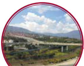
Puente de la Madre Laura $205.000 millones