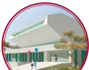
LVA Castilla $13.307 millones