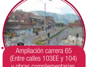
Ampliación carrera 65 (Entre calles 103EE y 104) y obras complementarias, etapa 2 $4.700 millones