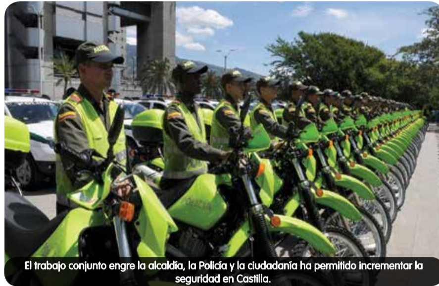
El trabajo conjunto entre la alcaldía, la Policía y la ciudadanía ha permitido incrementar la seguridad en Castilla.

Hacer de Medellín una ciudad para la vida ha requerido poner en marcha, en cada comuna y corregimiento de la ciudad, acciones concretas para fortalecer la seguridad, prevenir el crimen y mejorar la convivencia. En la Comuna 5 Castilla, el compromiso de las instituciones y la ciudadanía muestra resultados positivos en la reducción de hurtos a vehículos y motos.