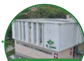
Centro de Salud Alfonso López $3.655 millones