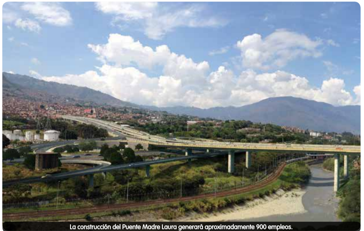
La construcción del Puente Madre Laura generará aproximadamente 900 empleos.