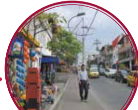
Boulevard Castilla $4.162 millones