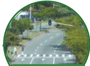
Ampliación cra 65, etapa 1 $6.261 millones