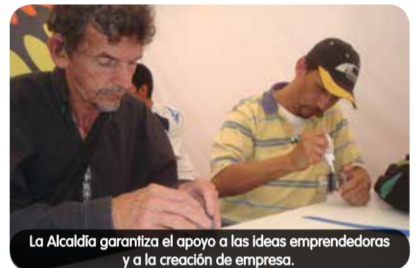
La Alcaldía garantiza el apoyo a las ideas emprendedoras y a la creación de empresa.

Por su parte, Interactuar plantea una iniciativa para promover el crecimiento económico en los territorios, a través del fortalecimiento empresarial de las comunas Popular, Manrique, Aranjuez, Castilla, Doce de Octubre, San Javier, Guayabal, Belén, y los corregimientos Altavista y Santa Elena, zonas que serán beneficiadas por el proyecto.